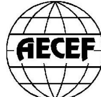
The Association of European Civil Engineering Faculties