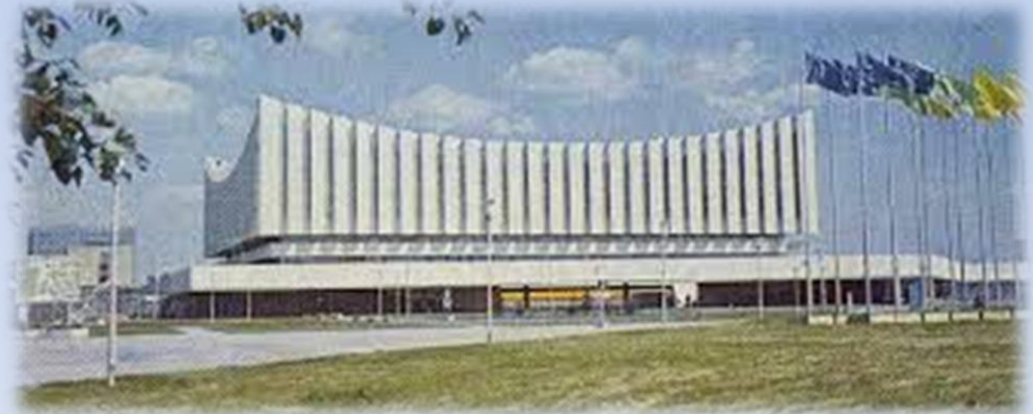
Универсальный спортивный зал «Измайлово»