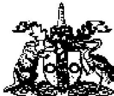
The Institution of Civil Engineers