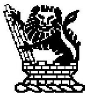
The Institution of Structural Engineers