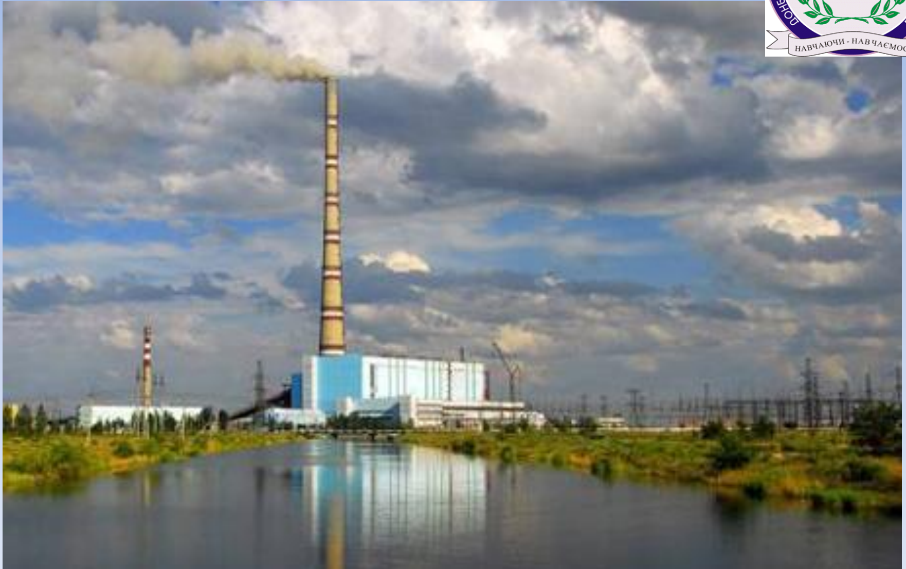
Труба Экибастузской ГРЭС-2