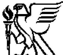
Chartered Institution of Building Services Engineers