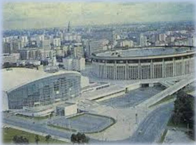
Крытый стадион и плавательный бассейн на пр. Мира