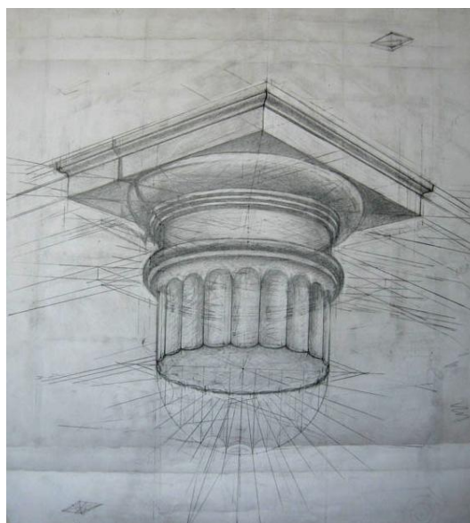
Рис. 1. Пример выполнения творческого задания « Рисунок »

Задание «Рисунок» выполняется на формате А-2 графическим карандашом. Длительность выполнения задания «Рисунок» - 180 минут. Использование канцелярских инструментов строго запрещается (линейки и другие направляющие средства черчения).