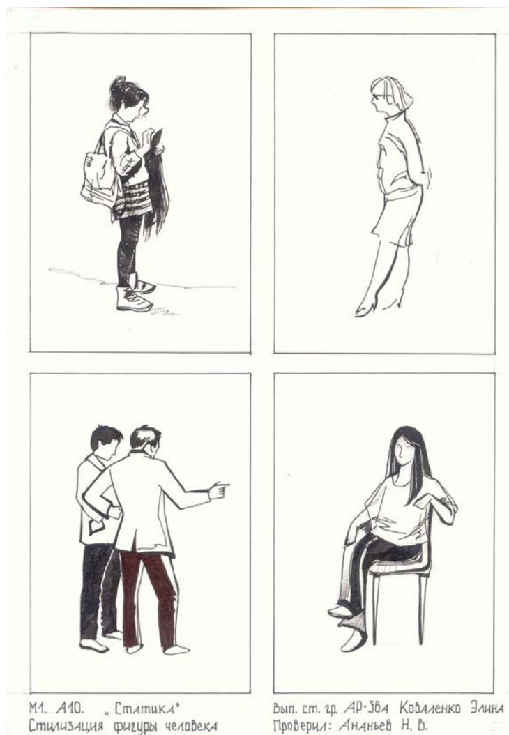
Рис. 2. Пример стилизации человека.