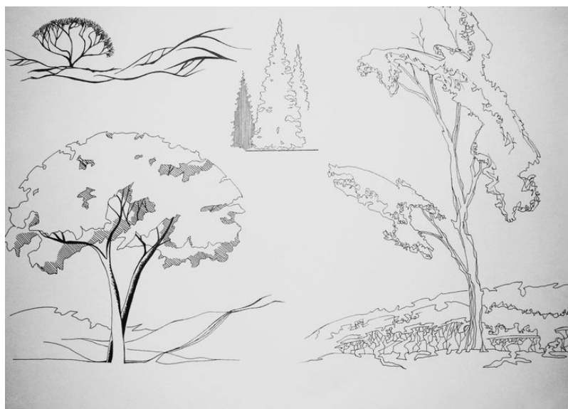
Рис. 3. Пример стилизации дерева.