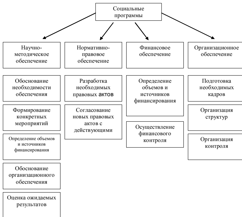
Рис. 1. Структурно-организационная схема социальной программы.

ко сужено. В литературе, посвященной государственному регулированию, социальные программы рассматриваются как программы перераспределения или программы бюджетных расходов на социальную сферу.