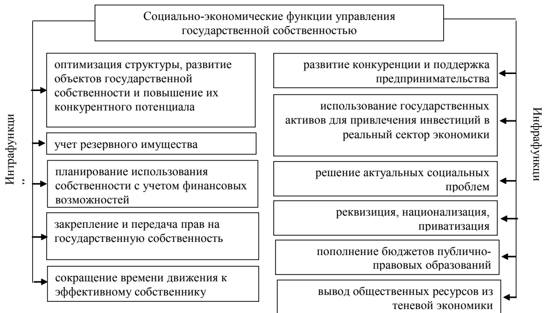
Рисунок 2. Социально-экономические функции управления государственной собственностью [8, с. 94].

ровое, инфраструктурное, информационное обеспечение. Инфрафункции управления государственной собственностью связаны с национальной экономикой в целом и в государственно-управленческом механизме являются «выходными» по отношению к «входным» интро-функциям (рис. 2).