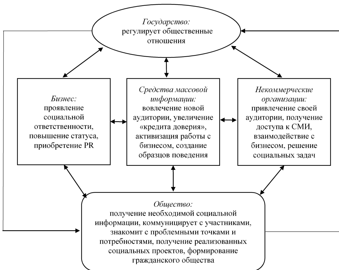
Рисунок 3 – Выгодополучатели взаимоотношений государства и бизнеса.

в Германии активно используются модели социального партнерства (государство, бизнес, профсоюзы совместно работают над развитием внешнеэкономической политики, поддерживая экспорт, создавая благоприятные условия для бизнеса за рубежом). Скандинавские страны тесно сотрудничают между государством и частным сектором в области внешнеэкономической политики (государственные агентства предоставляют поддержку и консультации компаниям, желающим выйти на международные рынки). В США программа Ex-Im Bank предоставляет финансирование и страхование для компаний, экспортирующих товары и услуги, что помогает поддерживать их конкурентоспособность на международной арене. В Китае осуществляется активная государственная поддержка с помощью программ («Создание бренда», «Глобальная стратегия») выхода на международные рынки, в том числе финансовая помощь,