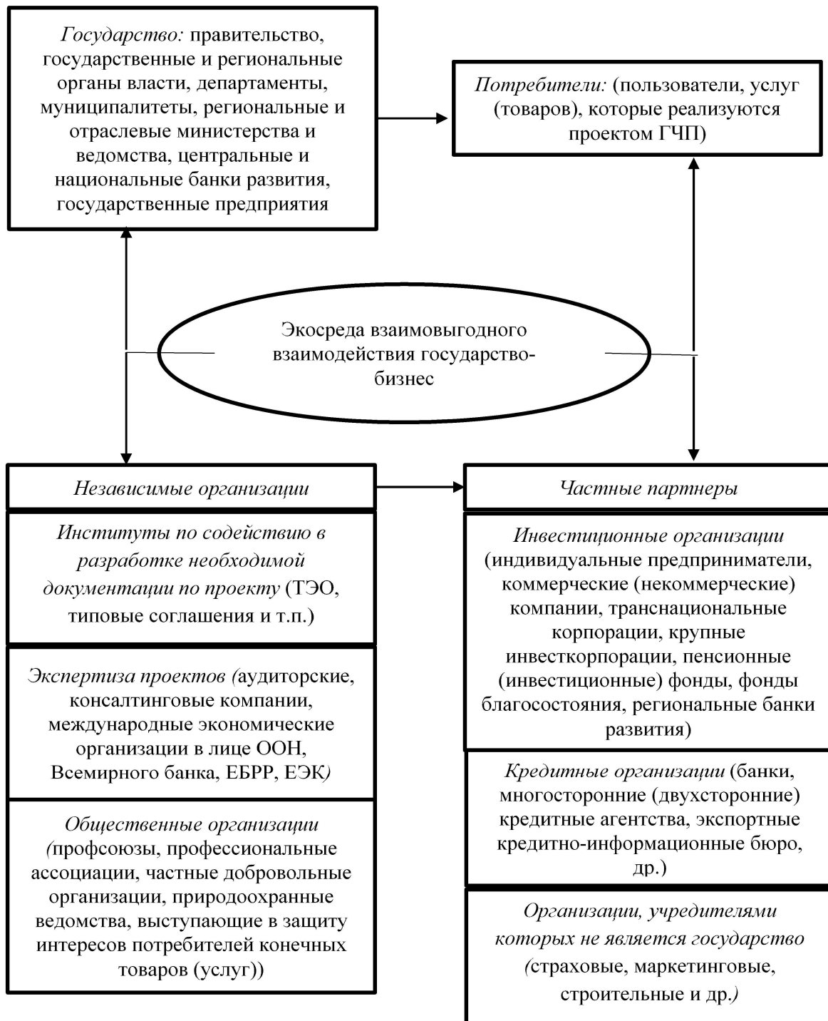
Рисунок 1 – Институциональная модель экосреды «государство-бизнес» [составлено автором].

эти проблемы, укрепить институты, обеспечить равные условия для всех участников рынка, повысить прозрачность и предсказуемость действий государства. То есть механизмами взаимодействия государства и бизнеса, помимо явно