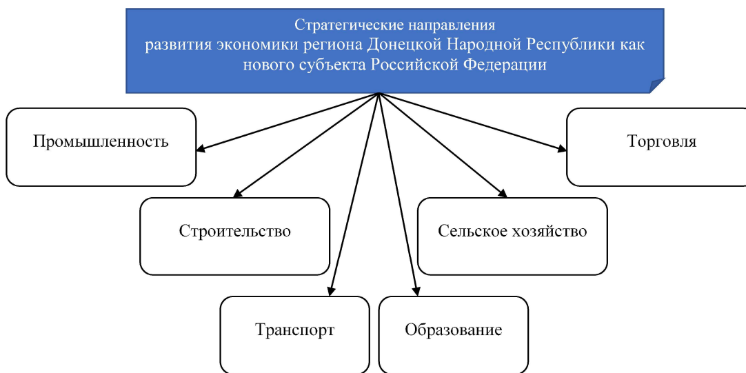
Рисунок 2 – Отраслевые стратегические направления развития экономики региона Донецкой Народной Республики (составлено авторами).

Переход на российские стандарты образования, также важно рассматривать в ходе мониторинга развития региона.