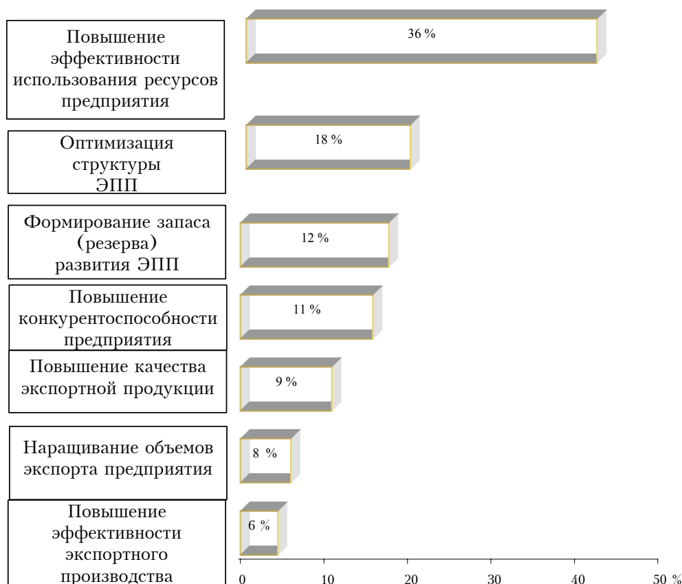
Рисунок 1. Интерпретация экспертами цели и задачи управления развитием экспортного потенциала предприятия (ЭПП).

Для идентификации и ранжирования факторов, тормозящих внедрение систем управления