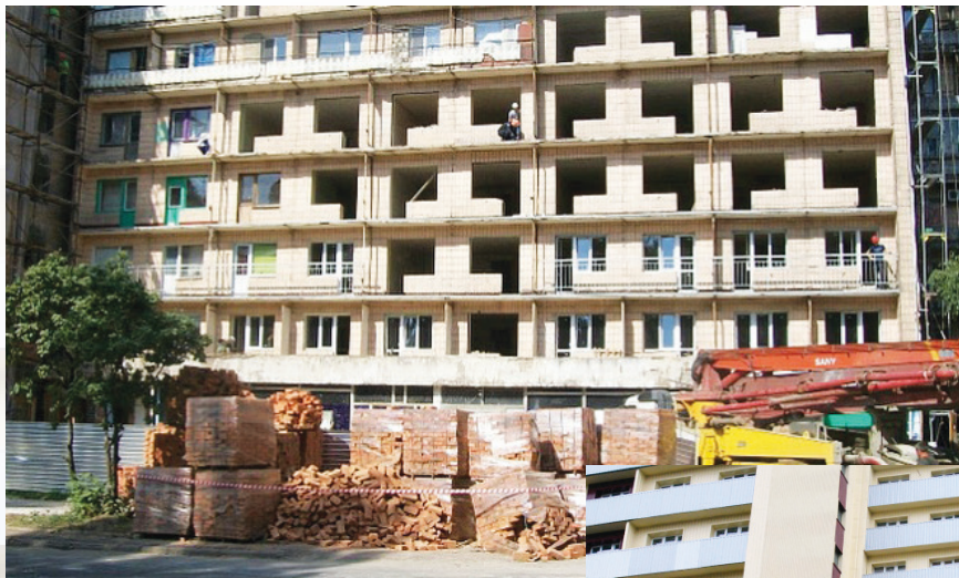
Реконструкция двух зданий бывшего общежития по ул. Розы Люксембург 2 и 2 а