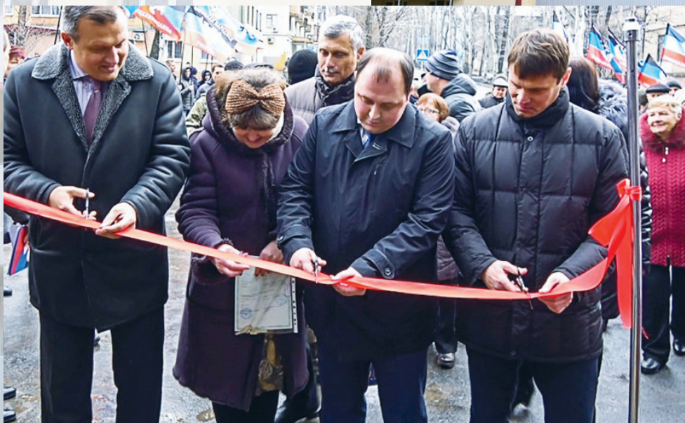
Торжественное мероприятие по вводу в эксплуатацию отремонтированных зданий