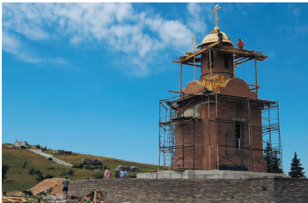
Благоустройство прилегающей территории на мемориальном комплексе «Саур-Могила»

Активно велась и ведётся работа над формированием законодательной базы в сфере строительства и ЖКХ. В планах Министерства на 2018-й год – программы развития манёвренного фонда, восстановления соцсферы и многоквартирных домов, возобновление строительства муниципальных нестроений, продолжение восстановления частного сектора.