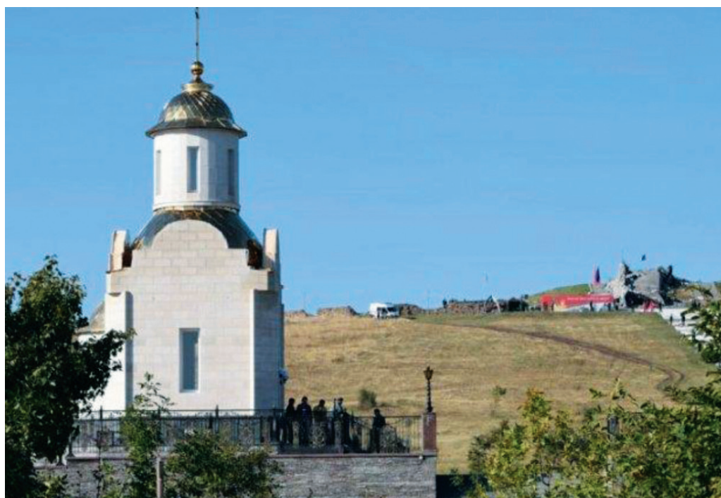
На Саур-Могиле в честь 74-летия освобождения Донбасса открылась часовня