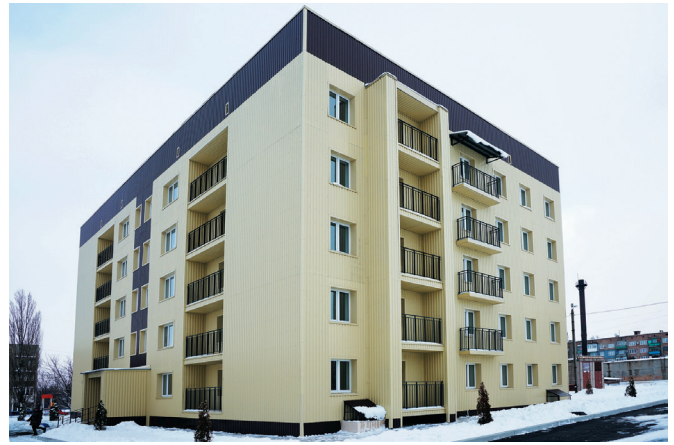
Достроенный по программе «манёвренного фонда» пятиэтажный жилой дом в микрорайоне Восточный г. Дебальцево