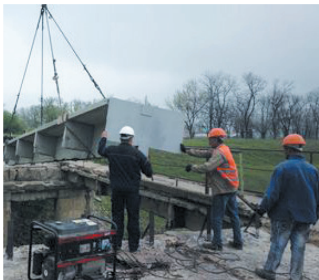
Рис. 3. Восстановление моста в Горловке