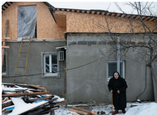
Рис. 1. Восстановление частных домов в ДНР