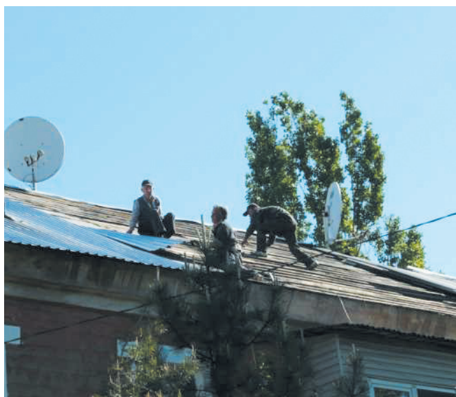
Рис. 2. Восстановление кровли многоквартирного дома в Горловке