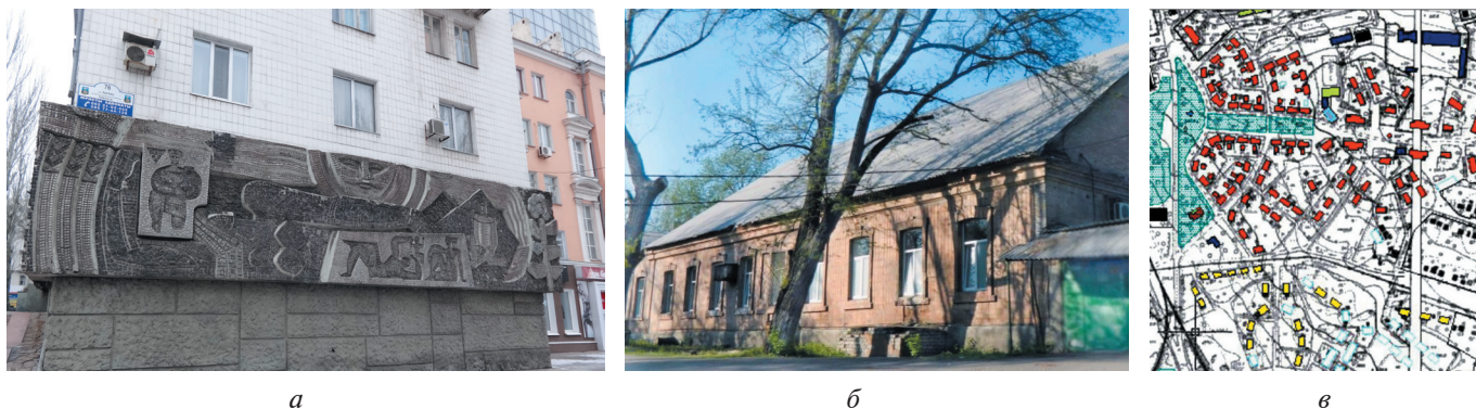
Рис. 2. Вновь выявленные ОКН на территории Донецкой Народной Республики: а) объект монументального искусства рельеф с мозаикой на здании по ул. Артёма, 74 в г. Донецке (около 1980 г.); б) объект истории: здание бывшего фельдшерско-акушерского пункта на 5 коек на территории Рудоболницы (бывшая пересыльная тюрьма) в г. Макеевке (середина 1870-х гг.); в) объект градостроительства: ансамблевая планировка и застройка пос. Новочайкино в г. Макеевке, 1924–1927 гг., арх. В. И. Пушкарёв, арх. В. К. Троценко