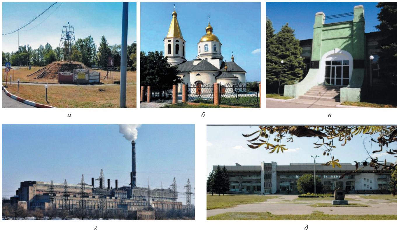
Рис. 1. Примеры памятников культурного наследия на территории Донецкой Народной Республики: а) курган «Щеглова Могила» на пересечении улиц Магистральной и 250-летия Донбасса в г. Макеевке; б) Свято-Николаевская церковь в пос. Ясиновка, 1811 г. (г. Макеевка); в) горноспасательная станция (в настоящее время музей МакНИИ), по ул. Лихачёва, 60 в г. Макеевке (1904–1907 гг., арх. А. Н. Бекетов); г) главный корпус бывшей Зуевской ГРЭС и экспериментальной ТЭЦ Всесоюзного теплотехнического института в г. Зугресе (1930–1939 гг., арх. П. Басков); д) железнодорожный вокзал в г. Иловайске (1981 г., ПИ Мосгипротранс, Москва, арх. В. М. Батырев)

тически и художественно не сочетаются с обликом ОКН, не согласованы друг с другом и выполнены на очень низком материально-техническом и дизайнерском уровне. Примером такого нарушения наглядно служит современное состояние здания кинотеатра им. Т. Г. Шевченко в г. Донецке – памятника архитектуры, фасад которого в конце 1990-х – начале 2000-х гг. был активно заполнен рекламными конструкциями и вывесками, кардинально изменившими не только