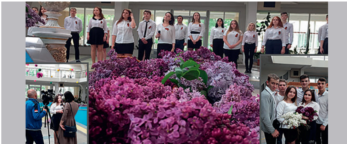
Студенты факультета «Экономическая теория и информационно-стоимостной инжиниринг» на флешмобе, посвященном празднованию 74-й годовщины Победы в Великой Отечественной Войне, 8 мая 2019 г.

ный мониторинг трудоустройства и поддерживает связь с выпускниками для создания баз практик и трудоустройства будущих специалистов. В настоящее время осуществляется тесное сотрудничество: с Министерством строительства и ЖКХ Донецкой Народной Республики, Министерством юстиции