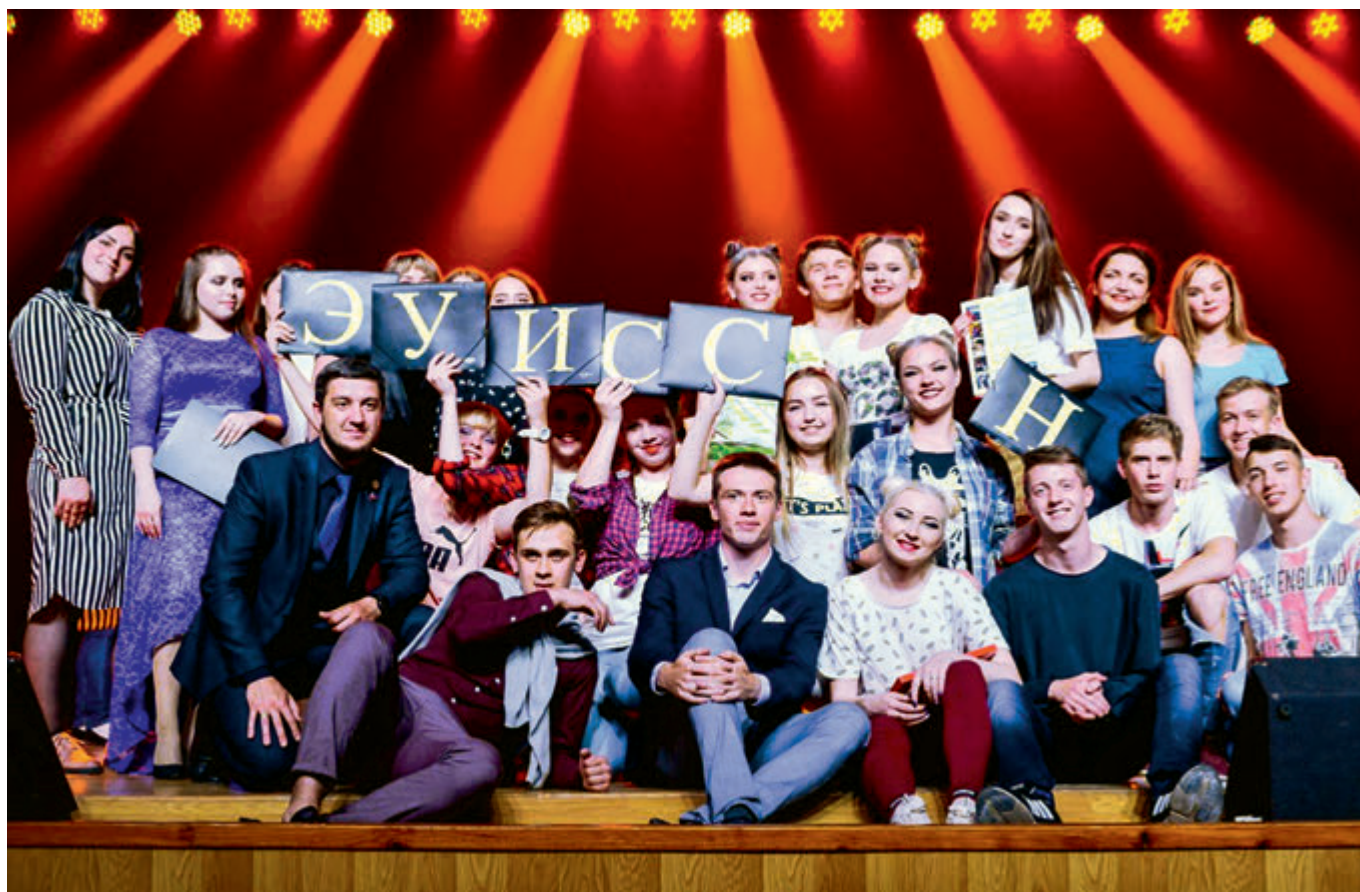
Студенты факультета «Экономика, управление и информационные системы в строительстве и недвижимости» на праздновании 25-летия факультета, 22 мая 2019 г.

Цель кафедры «Менеджмент строительных организаций» – подготовка конкурентоспособных кадров, способных обеспечивать эффективное управление