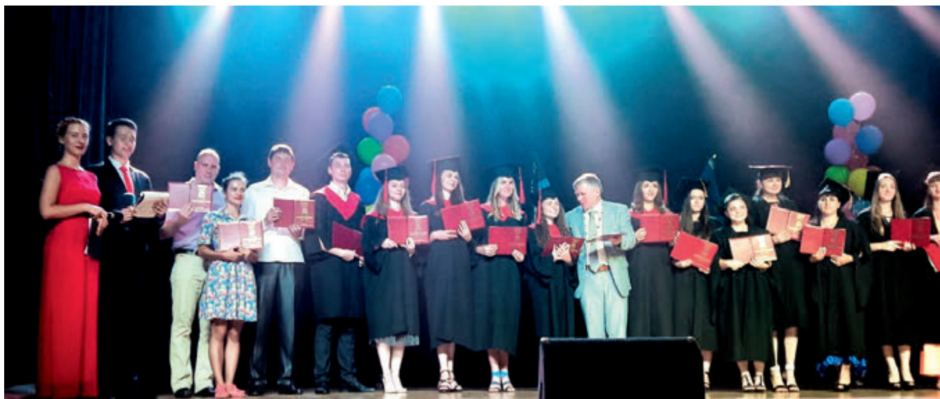
Вручение дипломов выпускникам факультета экономики, управления и информационных систем в строительстве и недвижимости, 29.06.2018 г.

Под руководством преподавателей кафедр факультета студенты продолжают принимать активное участие в международных и республиканских конкурсах научных работ, олимпиадах. За период существования факультета они 214 раз становились победителями олимпиад и конкурсов научных работ,