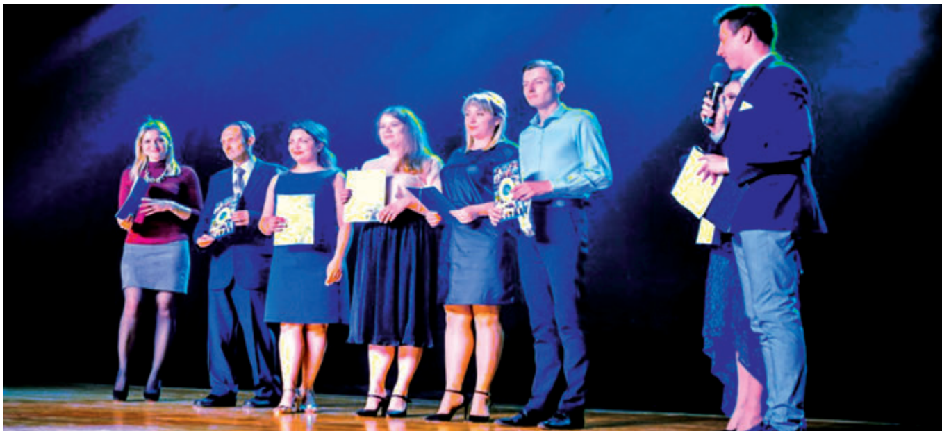
Награждение молодых преподавателей факультета «Экономика, управление и информационные системы в строительстве и недвижимости» в честь 25-летия факультета, 22 мая 2019 г.

в том числе за рубежом. Лучшее свидетельство востребованности выпускников на рынке труда говорит тот факт, что многие студенты получают работу уже на четвертом курсе во время прохождения практики. Выпускники факультета трудоустраиваются в органах государственного управления, различных строительных, жилищно-коммунальных организациях и т.д. Кафедрами факультета проводится постоян-