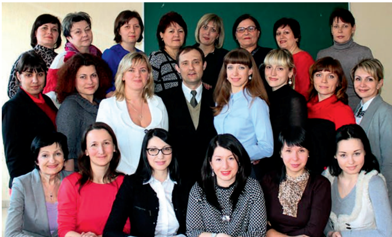
Коллектив кафедры «Экономика, экспертиза и управление недвижимостью», 2014 г.