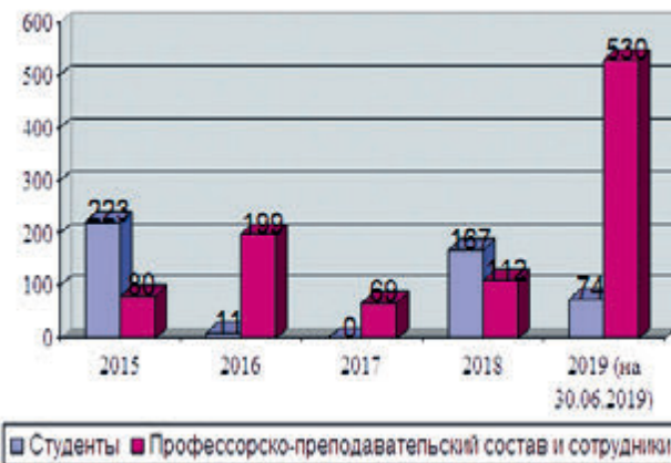
Рис. 1. Информация о полученном дополнительном профессиональном образовании, чел.

В учебном процессе широко используются современные активные методы обучения: тренинги, деловые игры, игровое производственное проекти-