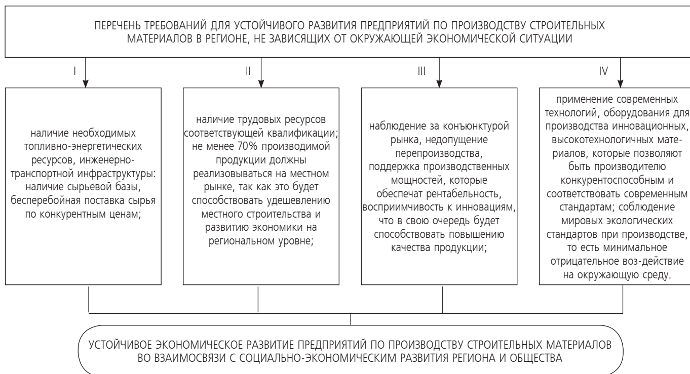
Рис. 2. Основные требования для устойчивого развития предприятий по производству строительных материалов в регионе

Эффективность государственной политики в той или иной сфере в значительной степени зависит от уровня ее планирования и программирования. Это предполагает разработку и в дальнейшем реализацию соответствующих государственных документов стратегического и тактического характера, которые содержат набор экономических и административных мер государственного регулирования экономики [11].