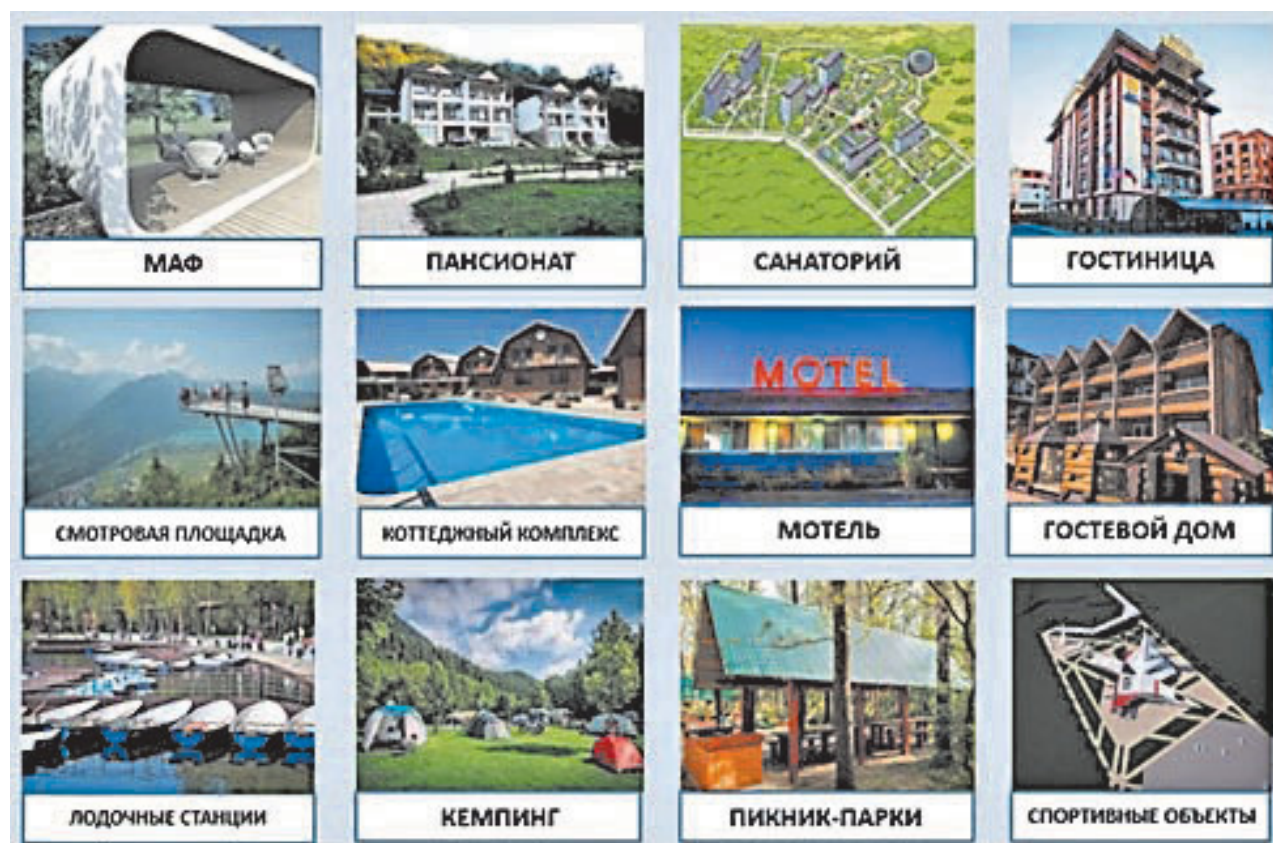
Рис. 1. Объекты – структурные элементы системы архитектурно-средовой адаптации объектов туризма

Вместе с тем, территория Донецкой Народной Республики обладает достаточным туристско-рекреационным потенциалом, позволяющим формировать и реализовывать разнообразные туры в сфере культурно-познавательного, активного, сельского, рекреационного и других видов туризма, ориентированных на различные возрастные группы и целевые аудитории (рис. 1).