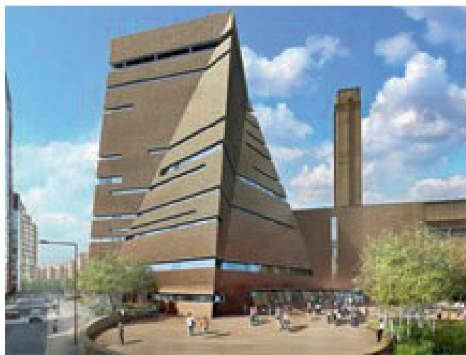
Рис. 4. Преобразование старого завода «Tate Modern» в музей современного искусства, Лондон, Великобритания

«Tate Modern», расположенный в Лондоне, представляет собой выдающийся пример адаптивного повторного использования промышленного здания, превращенного в музей современного искусства. Бывший завод, построенный в 1960-х годах, демонстрирует мощную брутальную архитектуру в стиле индустриализма с его характерными символами — массивными бетонными конструкциями и высокими дымовыми трубами. Архитекторы Герцог и де Мерон, занявшиеся реконструкцией здания в 1995 году, сохранили его оригинальные элементы, такие как открытые пространства и большие окна, что создало условия для естественного освещения и впечатляющих выставочных площадей.