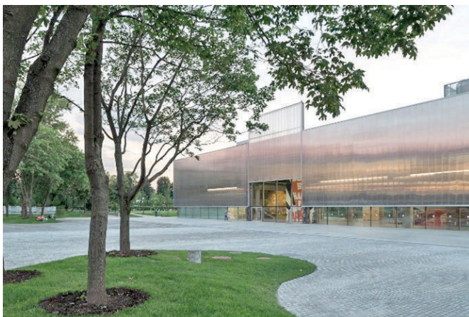
Рис. 5. Проект «Гараж» в парке Горького, Москва, Россия

Дизайнерский подход в «Гараже» акцентирует внимание на минимализме и современном искусстве, что отражается в использовании простых материалов и интеграции с природным окружением. Внутренние помещения оформлены в нейтральной цветовой палитре, что позволяет искусству занимать центральное место. Особенность «Гаража» заключается в его концепции как культурного пространства, которое призвано не только отображать современное искусство, но и активно вовлекать общество через лекции, мастер-классы и мероприятия на свежем воздухе. Это делает «Гараж» не просто музеем, а динамичным культурным центром, формирующим новую платформу для обсуждения и творчества в центре Москвы.