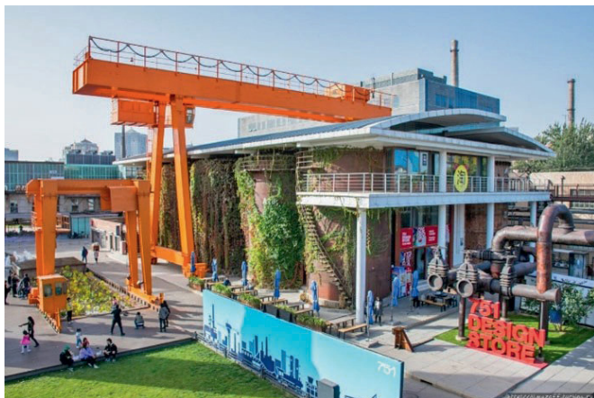
Рис. 3. Преобразование старого промышленного комплекса в культурный кластер «798 Art Zone» в Пекине, Китай