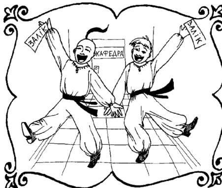
Дати волю ногам.