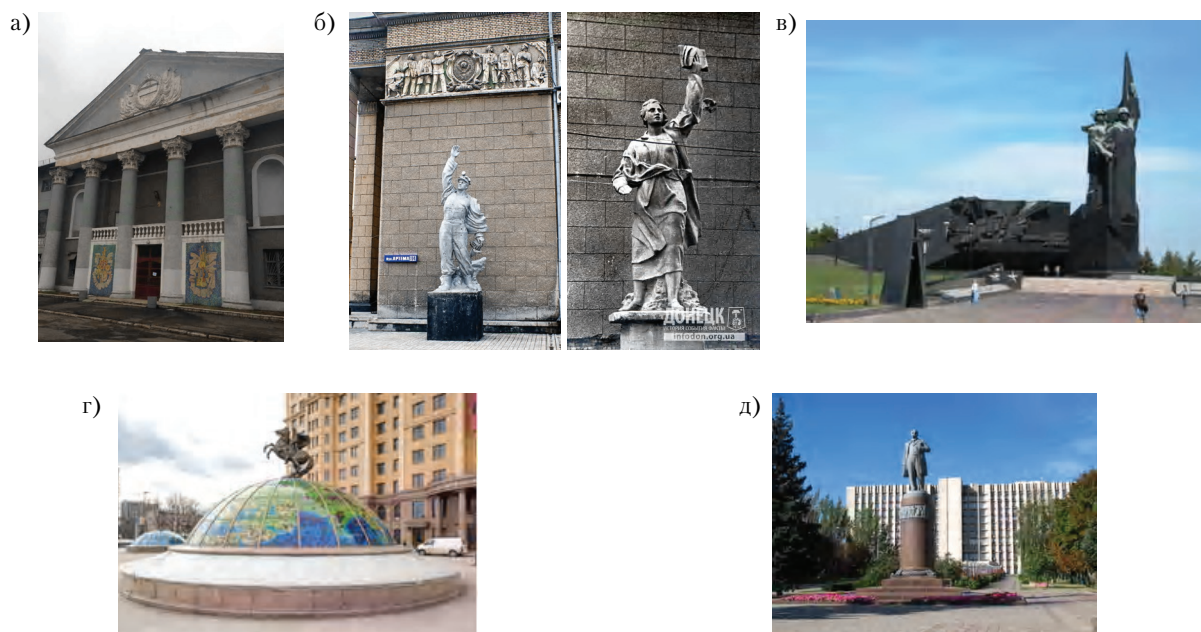
Рисунок 3 – Типы объемно-пространственной организации элементов монументально-декоративного искусства в архитектурных решениях зданий и сооружений в городах Донбасса: а) плоскостные мозаичные панно (2010 г., «Народное искусство» и «Академическое искусство», худ. А. Ф. Дереза) на фасаде Дворца культуры Донбасской национальной академии строительства и архитектуры (г. Макеевка); б) скульптуры «Труд» и «Наука», тематические барельефы в архитектурном ансамбле зданий Донецкого научно-исследовательского угольного института (ДонУГИ, 1953 г., арх-ры А. В. Лукьянов и В. К. Троцеико; скульпторы Н. Гинзбург и П. Гевеке), в) монумент «Твоим освободителям, Донбасс!» в комплексе с расположенными в постаменте и его заглубленной части Музеем Великой Отечественной войны и Художественным музеем «Арт-Донбасс» (1985 г., арх-ры В. Н. Кингкань и М. Я. Ксенович, скульп. Ю. И. Балдин, худ. А. Н. Порожнюк), г) объемная скульптурная композиция и витражные элементы в архитектурном и композиционно-художественном решении световых фонарей торгового центра «Северный» в г. Донецке, д) памятник Кобзарю Т. Г. Шевченко (скульпторы М. К. Вронский и А. А. Олейник, арх. В. А. Шарпенко) в архитектурном комплексе зданий в начале бульвара Шевченко в г. Донецке.