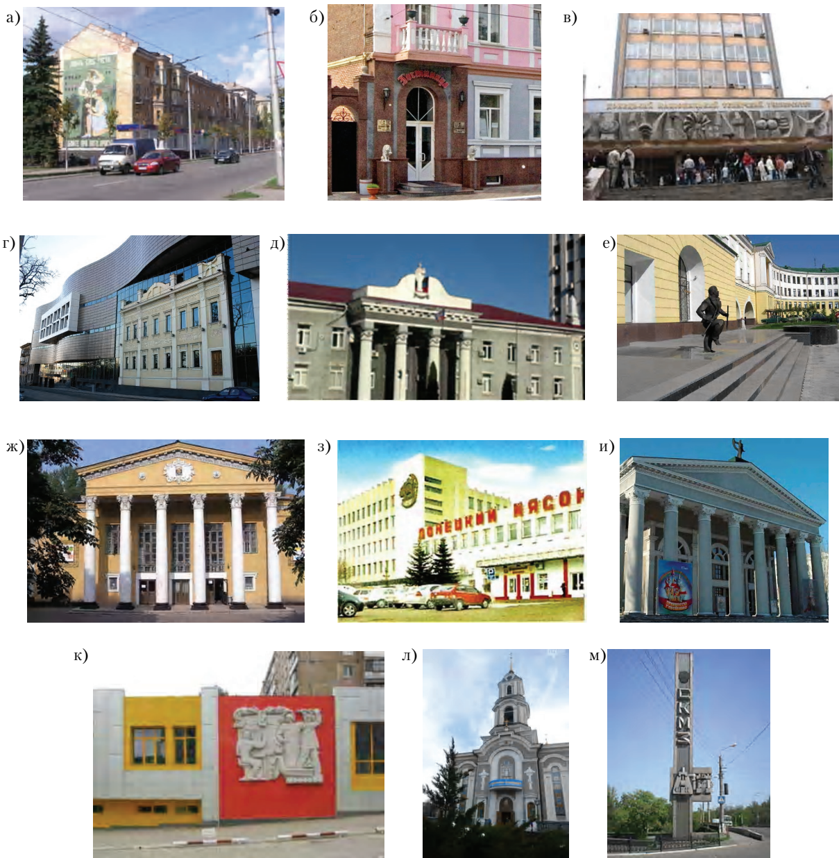
Рисунок 5 – Типы зданий и сооружений с элементами монументально-декоративного искусства в городах Донбасса а) многоэтажный жилой дом с плоскостным панно по ул. Ленина в г. Макеевке; б) историческое здание гостиницы «Великобритания» по ул. Постышева в г. Донецке со скульптурами львов у входа; в) 8 учебный корпус Донецкого национального технического университета по ул. 25-летия РККА с барельефом на главном входе; г) Торгово-офисный центр «GREEN Plaza» в г. Донецке с декоративным элементом на фасаде в виде объемного изображения фасада песочанившего купеческого особняка конца XIX – начала XX вв.; д) здание Ворошиловского межрайонного суда г. Донецка по ул. Челюскинцев с элементами монументального декора (обелиски, скульптура Фемиды); е) историческое здание Центра травматологии по ул. Артема в г. Донецке с тематической скульптурной композицией на главном входе (2001 г., скульпторы П. Чесноков, Ю. Балдин); ж) Дворец спорта «Шахтер» (памятник архитектуры) с элементами декора на фасаде (картуш и колоннах в г. Донецке (1953 г., архи-ры Г. И. Навроцкий и О. К. Терзян); з) фасад здания мяскокомбината в г. Донецке с декоративным барельефом-эмблемой предприятия; и) здание Донецкого музыкально-драматического театра со скульптурой Мельпомены на фронте (2005 г., скульптор Ю. И. Балдин), к) здание бывшего гастронома «Армения» с тематическим панно в г. Донецке по Ленинскому проспекту; л) архитектурный ансамбль Свято-Преображенского кафедрального собора с элементами фасадного декора, витражами и скульптурной композицией, изображающей Архистратига Михаила (покровителя г. Киева) в г. Донецке (2004 г., арх. В. В. Ануфриенко), м) архитектурно-декоративное решение въездного знака Старокраматорского машиностроительного завода в г. Краматорске.