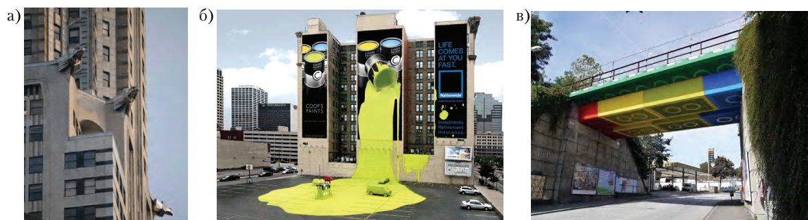
Рисунок 2 – Примеры решения элементов монументально-декоративного искусства рекламного характера в архитектуре зданий и сооружений: а) скульптурные изображения эмблемы фирмы Крайслер на здании офиса корпорации в г. Нью-Йорк (США), б) синтез монументально-декоративных элементов рекламы красок COOPS' Paints на здании страховой компании Nationwide (США), в) реклама продукции Lego в архитектурном решении транспортного моста в г. Вуппергаль (Германия).

Выявлены следующие типы объемно-пространственной организации элементов монументально-декоративного искусства в архитектуре зданий и сооружений в городах Донбасса: плоскостные (рис. 3а); сочетающие плоскостные и объемные формы (рис. 3б); объекты (произведения) монументально-декоративного искусства, составной частью которых являются архитектурные объекты, в том числе заглабленного характера (рис. 3в); элементы монументально-декоративного искусства, являющиеся наземной частью заглабленного сооружения (рис. 3г); объекты (произведения) монументально-декоративного искусства в составе архитектурно-градостроительных ансамблей (рис. 3д).