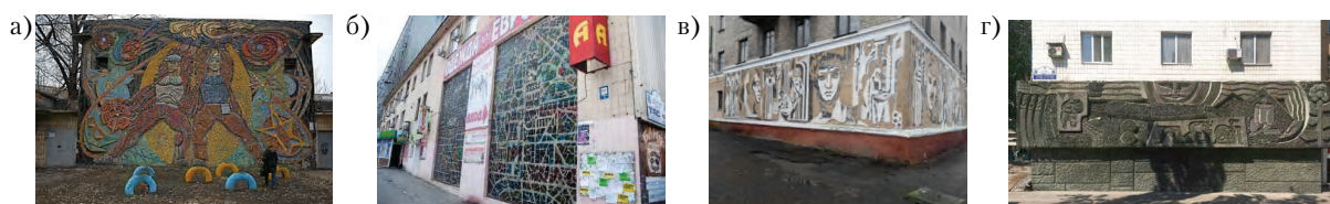
Рисунок 4 – Различные техники выполнения плоскостных элементов монументально-декоративного искусства в архитектуре зданий и сооружений в городах Донбасса: а) мозаика «Прометей» на фасаде школы № 5 в г. Донецке (1960-е гг., худ. А. Горская и В. Зарецкий), б) витраж на фасаде здания гастронома «Москва» в г. Донецке, в) роспись на фасаде жилого дома в г. Горловке, г) барельеф «Земля Донецкая» (1967 г., скульпторы В. Прядко, И. Литовченко) на фасаде жилого дома по ул. Артема (бывший гастроном Донецк) в г. Донецке.

Выявлены основные типы зданий сооружений в городах Донбасса (с учетом общепринятой типологической классификации зданий и сооружений [9]), архитектурные решения которых включают элементы монументально-декоративного искусства: в том числе жилые многоквартирные дома (рис. 5а), гостиницы (рис. 5б), учебные (рис. 5в) и административные (рис. 5д) здания, здания здравоохранения (рис. 5е), спортивного назначения (рис. 5ж), зрелищного характера (рис. 5и), здания торговли (рис. 5к), многофункциональные комплексы (рис. 5г), производственного назначения (рис. 5з), культовые здания (рис. 5л), малые архитектурные сооружения (рис. 5м).