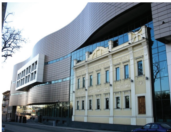
Рисунок 5 – Пример современной архитектурной интеграции несохранившегося исторического здания: воссоздание облика фасада особняка 1906 г. на фасаде торгово-офисного центра Green Plaza по ул. Постышева в г. Донецке (2008 г., ООО ТПЦ «Среда»).

экономических условиях, а также отсутствием научно-обоснованной концепции, учитывающей как международный опыт в этой сфере, основанной на анализе факторов, определяющих особенности решения названной проблемы на территории Донецкого региона.