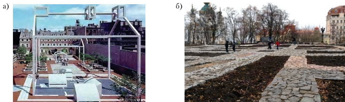
Рисунок 3 – Примеры практики маркировки границ пространства значимых несохранившихся и виртуальных объектов: а) пространственные контуры несохранившихся построек и участка исторического комплекса мемориала Бенджамина Франклина в Филадельфии (США, 1976 г., арх. Р. Вентури); б) восстановленный оригинальный контур фундамента Десятинной церкви в Киеве, открытый для прогулок.