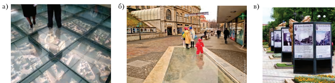
Рисунок 4 – Примеры из опыта современной архитектурной интеграции объектов исторического культурного наследия: а) макет городской исторической застройки; б) фрагмент археологических раскопок под стеклом на площади Свободы в Таллинне (Эстония, 2009 г.); в) стенды с информацией по истории и архитектуре посёлка Юзовки на бульваре Пушкина в г. Донецке (2015 г.).