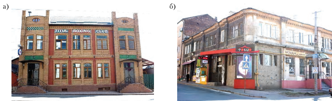
Рисунок 3 – Неподобающие изменения на фасадах зданий 1869–1917 гг. в Ворошиловском районе: а) «Дом Кроля»; б) угловой дом по ул. Лагутенко.