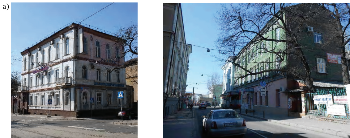
Рисунок 2 – Гостиницы 1869–1917 гг.: а) «Великобритания»; б) «Гранд-отель».