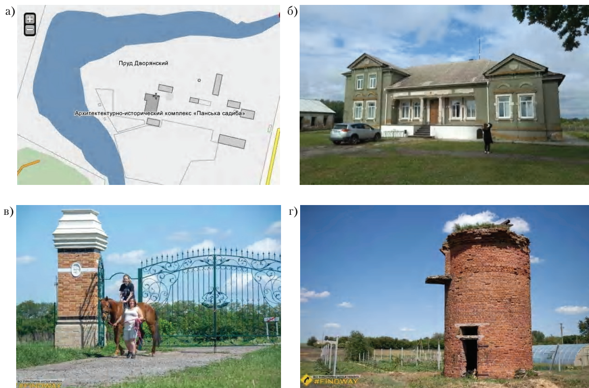
Рисунок 8 – Усадьба и дом Г. Судермана «Панская усадьба» (1897–1914 гг.) в с. Зелёном в Добропольском районе: а) схема усадьбы; б) общий вид дома (современное фото); в) общий вид въезда на территорию усадьбы; г) общий вид водонапорной башни.

торического памятника для посещения туристами. Несколько лет ушло на реконструкцию сооружений исторического комплекса. Создан мини-зоопарк, птичник и овечья ферма. В магазине продаётся сыр, молоко, масло, яйца. Посетители усадьбы могут обучиться азам верховой езды или покататься в карете, запряжённой парой-тройкой вороных. На территории высажен молодой сад и виноградник, у пруда установлены качели и беседка. С переоборудованной в смотровую площадку водонапорной башни (рис. 8, г) открывается панорама окрестностей с древними курганами и лесонасаждениями. Планируется открыть мини-гостиницу для посетителей, устраивать конференции, другие массовые мероприятия для популяризации усадьбы.