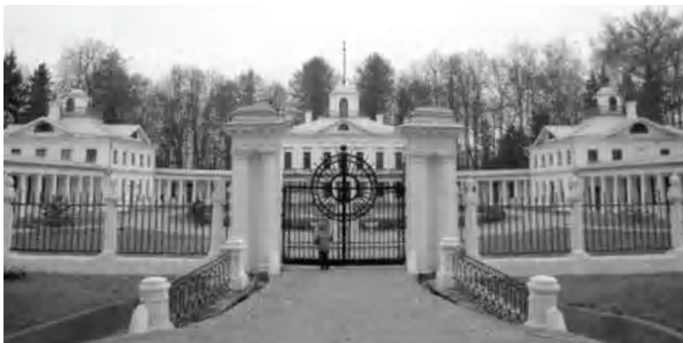
Рисунок 2 – Усадьба Средниково Солнечногорского района Московской области. Вид центральной части (фото 2006 г.).

Один из наиболее рекламируемых сегодня отечественных примеров старинных усадеб, находящихся в частных руках, – Средниково в Московской области – усадьба, связанная с именем поэта М. Ю. Лермонтова (рис. 2). В настоящее время усадьба арендуется ассоциацией потомков поэта. Территория усадьбы огорожена и строго охраняется, доступ туристов ограничен и осуществляется только по предварительной записи. Всячески приветствуется проведение коммерческих мероприятий – концертов, семинаров, торжеств и т. п. Хозяйственные и производственные постройки, равно как и смежные территории, в функциональной программе усадьбы не участвуют. Положительно, что центральная часть усадьбы имеет ухоженный вид, вместе с тем в реставрации использованы почти исключительно современные стандартные материалы и изделия, что явно разрушает дух усадьбы.