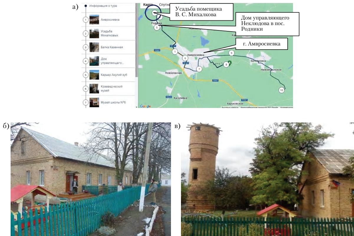
Рисунок 5 – Усадьба Михалковых в Амвросиевском районе: а) схема туристического маршрута, включающего посещение места размещения усадьбы Михалковых и дома управляющего; б) дом управляющего усадьбой Неклюдова в пос. Родники 16 (современное фото); в) водонапорная башня рядом с домом управляющего в пос. Родники.

Усадьба помещика В. А. Бантыша в пгт Камышевах г. Краматорска (основана в конце XIX в.) – небольшое имение (рис. 6, б) и добротный загородный дом успешного функционера-политика Российской империи на стыке XIX–XX вв. После распада СССР здание усадьбы долгое время оставалось заброшенным. Первую половину XX в. внешний вид дома почти не менялся. В 1970-х гг. вместо мансарды был достроен полноценный второй этаж, а также возведены пристройка к дому и несколько хозяйственных построек на территории бывшего имения. В середине 1990-х гг. усадьба вошла в состав регионального ландшафтного парка «Краматорский», но здание дома не использовалось. После 2014 г. Департамент экологии Донецкой ОГА, в подчинение которого находятся парк, инициировал реконструкцию имения с целью организации в нём визит-центра. На территории вокруг дома установили вольеры с животными, беседки, зоны барбекю. В усадьбе планировалось разместиться Музей природы. В течение нескольких лет была заменена крыша, установлены забор и ворота, возведены фонтан и малые архитектурные формы, выполнено благоустройство въезда, дороги и тротуара на территории центра, выполнена реконструкция здания (рис. 6, а), в том числе пристроен зал заседаний (рис. 6, б). В 2020 г. усадьба была включена в государственную программу «Большая стройка» и в 2021–2022 гг. её снова подвергли реконструкции. В итоге аутентичный вид усадьбы и её основного здания был значительно нарушен.