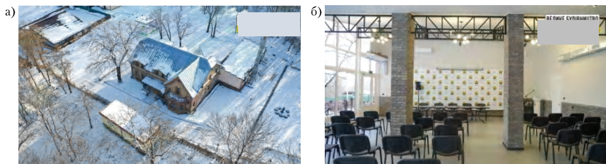
Рисунок 6 – Усадьба В. А. Бантыша в пгт Камышеваха г. Краматорска: а) общий вид дома после реконструкции; б) общий вид пристроенного зала заседаний.