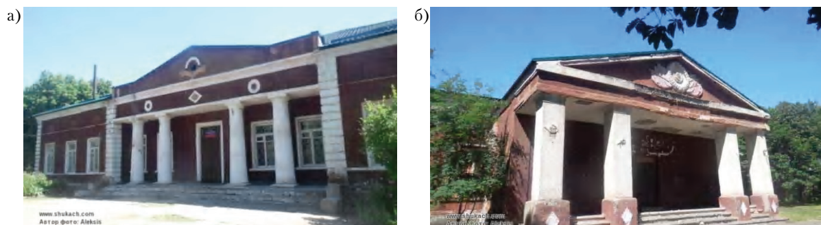
Рисунок 9 – Усадьба помещика Д. И. Иловайского (конец XVIII – начало XX в.) в пос. Зуевка г. Харьцызска ДНР: а) общий вид юго-западного фасада бывшего дома помещика; б) общий вид северо-восточного фасада с пристройкой 1950-х гг.

2. Сформулированы цель, задачи и научная программа исследования рассматриваемой проблемы с учётом региональных и конкретных местных предпосылок, факторов и условий и современных требований, вытекающих из их анализа, а также с учётом анализа аналогичных примеров из международной практики в сфере архитектурно-градостроительной реинтеграции исторических усадеб. Определены объект и предмет, методика и методология исследования, предполагаемые его результаты, научная новизна и научно-практическое значение.