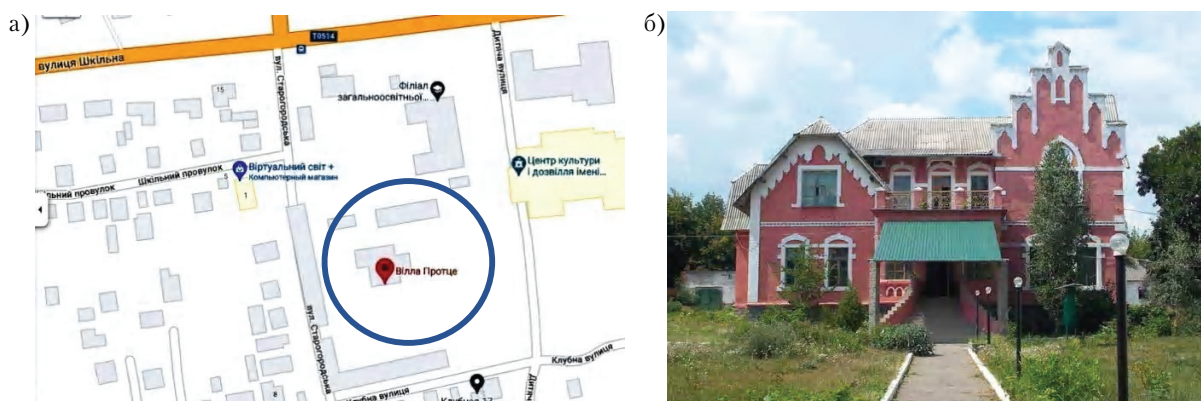
Рисунок 4 – Вилла Э. Протце в г. Краматорске: а) схема расположения в городской структуре; б) общий вид здания.

Особняк построен ориентировочно в 1909 – начале 1910-х гг. в эклектичной стилистике с преобладанием неоготических мотивов (рис. 4, б), его внешний облик и внутренняя планировка дошли до нашего времени с небольшими изменениями, а историческое окружение утрачено. В настоящее время дом находится в старой части Краматорска, рядом со зданием филиала школы № 6 (рис. 4, а). Начиная с 1917 г. в здании располагалось отделение ЧК, затем ГПУ и НКВД, во время немецко-фашистской оккупации 1941–1943 гг. – гестапо, а после освобождения с сентября 1943 г. – снова НКВД. До последнего времени в здании виллы Протце размещается городское отделение милиции и полиции.