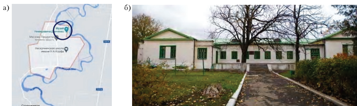
Рисунок 7 – Мемориальный музей-усадьба Н. А. Корфа и В. И. Немировича-Данченко в с. Нескучном Великоновоселковского района ДНР: а) схема размещения усадьбы на территории села; б) общий вид усадьбы.

статус памятника истории и культуры, а с 1992 г. дом был занесён в госреестр национального культурного достояния Украины. В 1993 г. по решению Донецкого облисполкома в усадьбе открыт филиал Донецкого областного краеведческого музея, посвящённый В. И. Немировичу-Данченко. В его экспозиции находятся личные вещи В. И. Немировича-Данченко и Н. А. Корфа. Музей располагается в усадебном доме посреди парка (рис. 7, а).