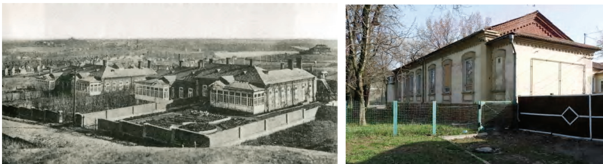
Рисунок 4 – Английская колония: общий вид на историческом фото, современное состояние одного из жилых домов английских колонистов (г. Донецк).

Площадь не утратила своей значимости и сегодня на ней находится крупнейший элеватор Приволжья, который функционирует и выпускает зерно экстра-класса. Исторические здания хлебной биржи и старого элеватора признаны объектами культурного наследия и являются точками прироста туристов [5].