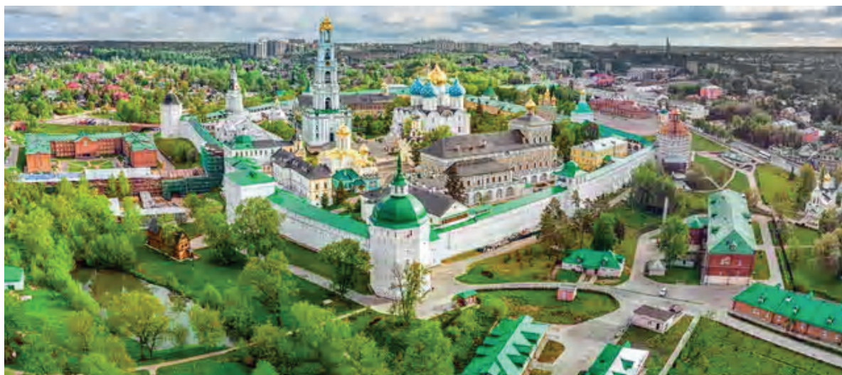
Рисунок 6 – Общий вид на историко-архитектурный комплекс «Ростовский Кремль».

Историко-архитектурный комплекс, раскрывающий многовековую историю города являющийся древнейшей частью и цитаделью Казани – Казанский кремль (рис. 7). Комплекс занимает внушительную территорию и напоминает музей под открытым небом [7].