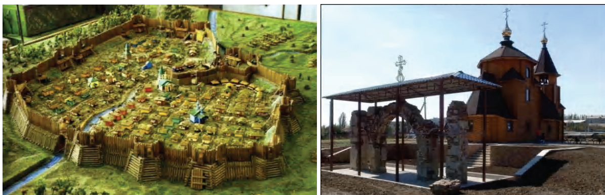
Рисунок 3 – Общий вид крепости Бахмут на территории современного г. Артемовска (макетная реконструкция), современный вид Храма святителя Иоанна Златоуста епархии (фото 2021 г.)