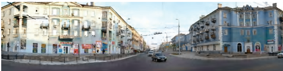
Рисунок 2 – Общий вид исторической застройки в районе пересечения ул. Ленина и ул. Московской в историческом ареале «Центральный» в ГО 10 Макеевка.